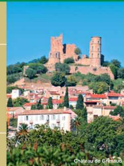
Château de Grimaud

If you are tempted by the open sea: then make towards the Iles d'Hyères and their nature reserves. Sky blue, olive green, sunshine yellow: you choose the colours for your holiday, here you are the "PASCHA" !