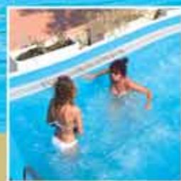
Jumping ball - Hammam - Jacuzzi - Mur d'escalade - Piscine californienne